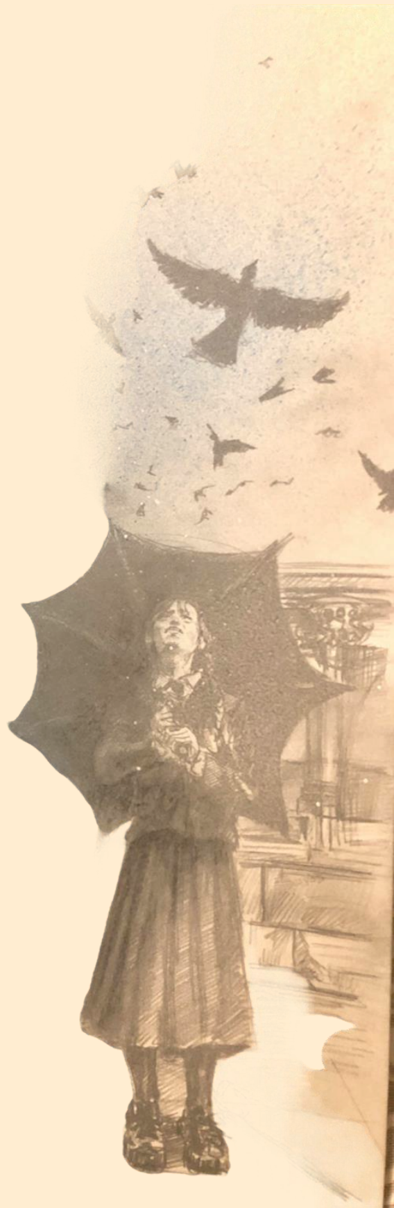
Locandina disegnata da Chiara Corradi

L'intento del contest è che le illustrazioni dei partecipanti e la mostra che ne deriverà possano essere motivo di riflessione e crescita per tutti. Affrontare la propria oscurità, il proprio lato dark è il primo passo verso la crescita e la consapevolezza di sé.